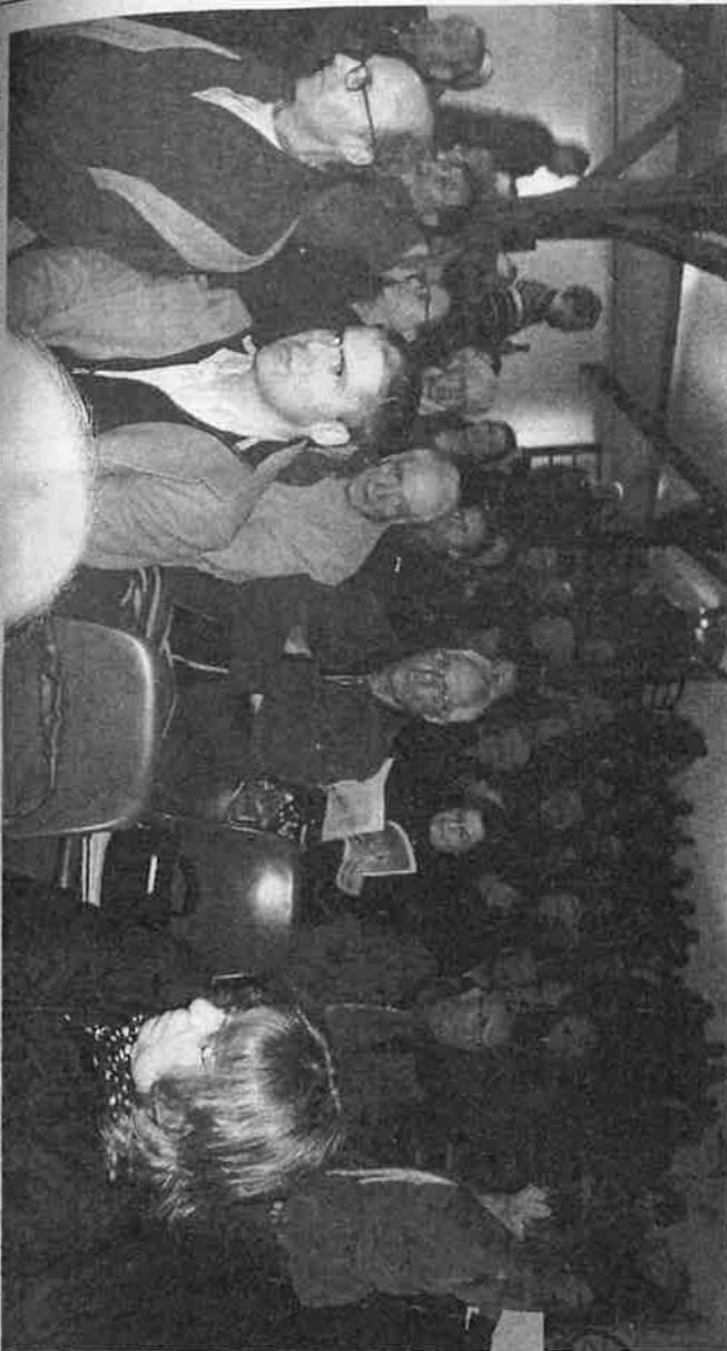
La salle des Granges-aux-Dîmes n'était pas suffisamment grande, mercredi soir, pour contenir toutes les personnes désireuses d'en savoir davantage sur le déploiement du compteur « intelligent ». Linky à leur domicile d'ici avril.

Plus de 200 personnes ont assisté, mercredi, à la réunion publique sur le déploiement de ce compteur « intelligent », prévu au mois d'avril prochain.